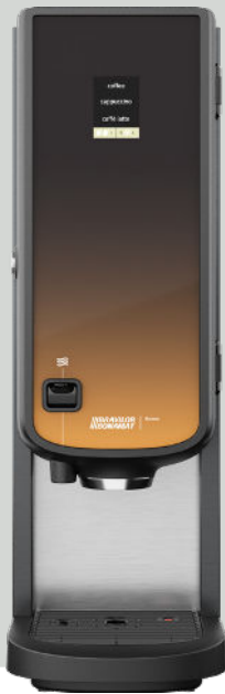
Bolero 21 met heetwateraftap