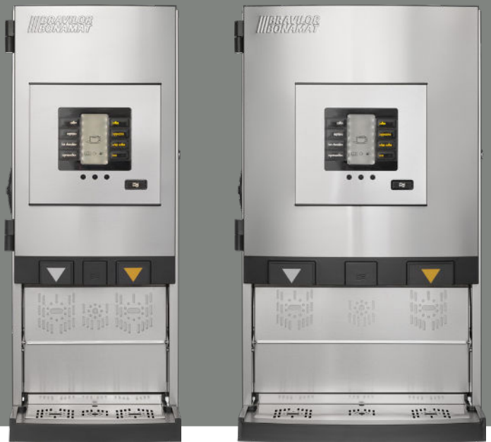
Bolero Turbo XL 403