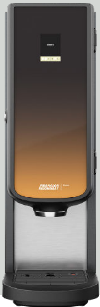
Bolero 11 zonder heetwateraftap