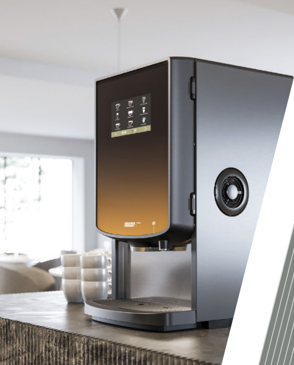
Bolero Turbo 403